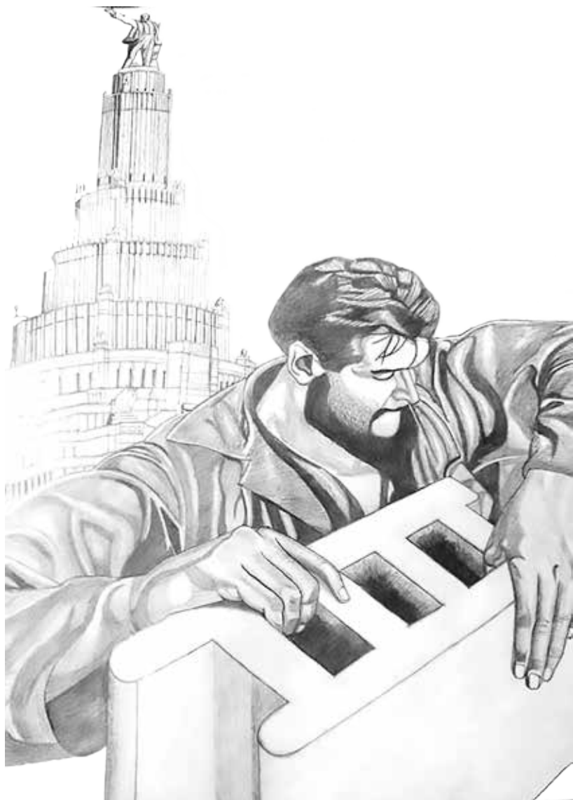
Alexander Mella El Che y el Palacio de los soviets